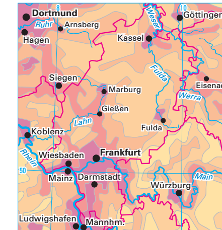
3 Thematische Karte