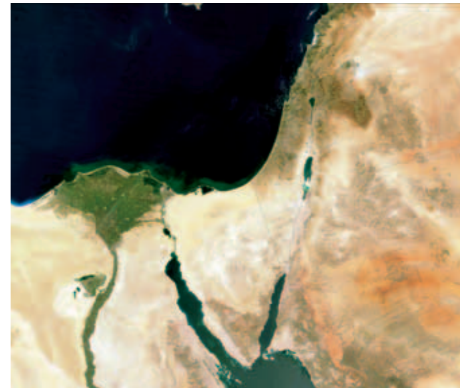
1 Satellitenbild des Nildeltas, der Halbinsel Sinai und eines Teils des Nahen Ostens vom 10.09.2000