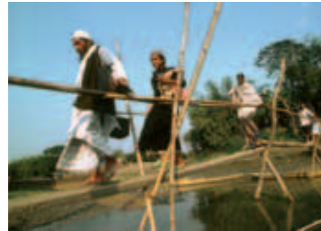
18 Bangladesch: Überschwemmungsgefährdetes Gebiet

Die Sensoren zeichnen reflektierte elektromagnetische Strahlung auf, die jede Oberfläche und jedes Objekt in charakteristischer Weise (d.h. in unterschiedlichen Wellenlängen) abstrahlt. Letztendlich werden die auf verschiedenen Kanälen aufgezeichneten Wellen unterschiedlicher Länge zu einem nahezu beliebig variierbaren digitalen, farblich kodierten Bild zusammengesetzt. Auf diese Weise können selbst für das menschliche Auge unsichtbare Wellenlängen visualisiert werden (z.B. das gesamte Infrarotspektrum).