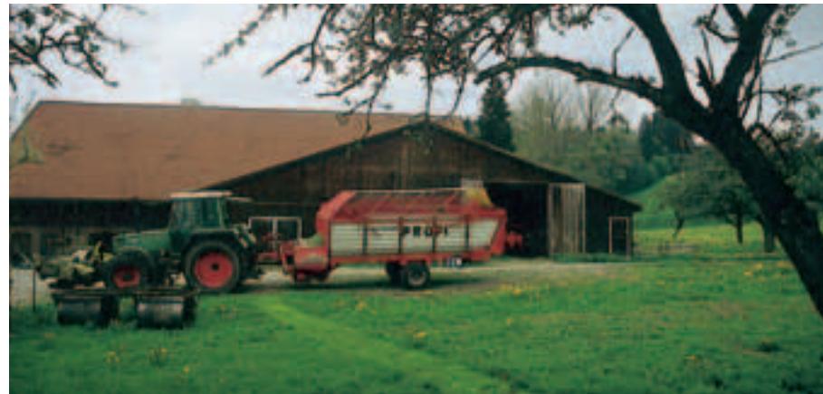
1 Stallungen und Maschinen