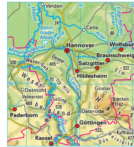
2 Physische Karte