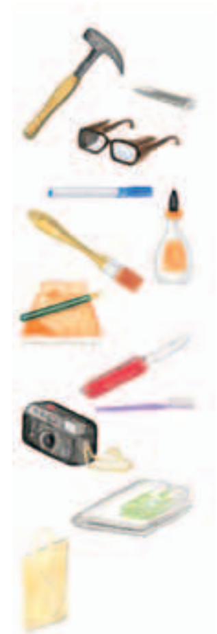
5 Hilfsmittel zum Anlegen einer Sammlung

Sammeln kann begeistern: Autogramme, Briefmarken, CD's ... Die Liste ließe sich im Alphabet fortsetzen. Ganz gleich, auf welchem Gebiet du sammelst, jede Sammlung erfordert eine systematische Ordnung und du wirst auf diesem Gebiet allmählich zum Experten. Dies gilt auch für das Sammeln von Gesteinen.