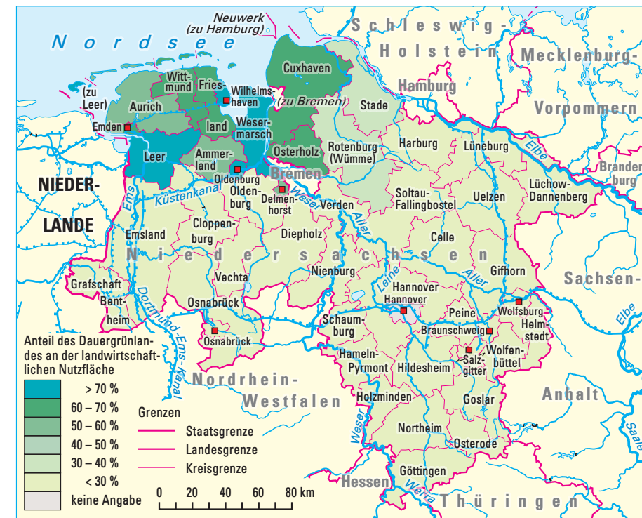
2 Grünlandwirtschaft in Niedersachsen 2003