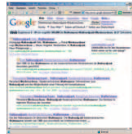
2. Schritt: Ergebnisliste

verknüpft. Das erkennst du daran, dass sich beim Herüberführen der Mauszeiger verändert. Wenn du mit der Maus auf einen solchen Verweis (Link) klickst, wird eine weitere Seite aufgeschlagen und du erhältst zusätzliche Informationen. Du kannst nun durch Lesen der Seite feststellen, ob sie für die Bearbeitung hilfreich ist.