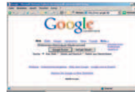
1. Schritt: Suchbegriffe eingeben

Es gibt zahlreiche Quellen für Informationen: Lexika, Fachbücher, Zeitungen oder das Internet. Gerade das Internet ist für die schnelle Beschaffung von aktuellen Informationen sehr gut geeignet. Wer aber nicht gezielt sucht und die gefundenen Seiten kritisch prüft, der wird sich im Dschungel des weltweiten Netzes verirren.