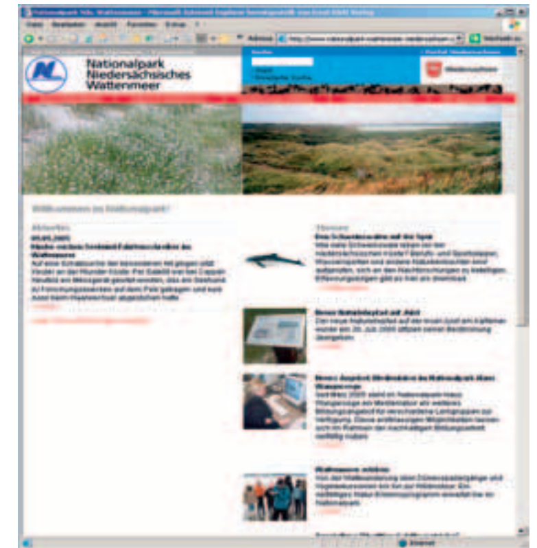
3. Schritt: Ergebnis

Wenn du auf den Seiten der gewählten Adressen nicht fündig wirst, kannst du mit dem Zurück-Button wieder zur Liste der Suchmaschine gelangen und die nächste Adresse wählen.