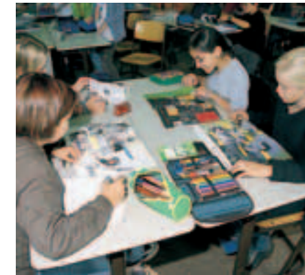
1 Präsentationsmaterial aufbereiten