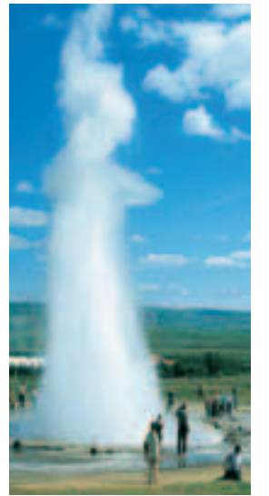
4 Ein Geysir