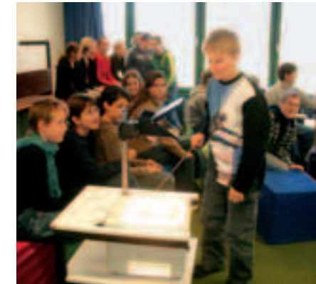
2 Durchführung der Präsentation