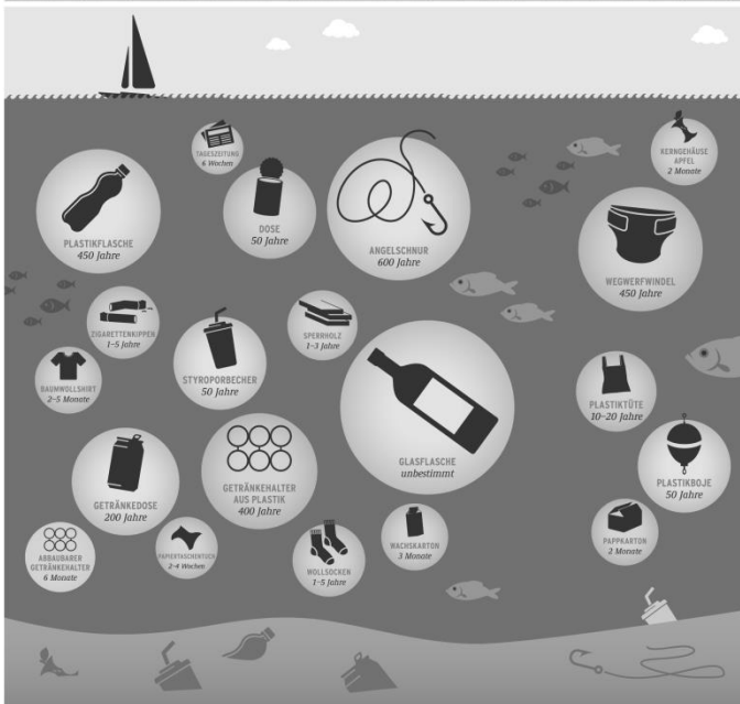
[1] Wann verrotten unsere Abfälle?