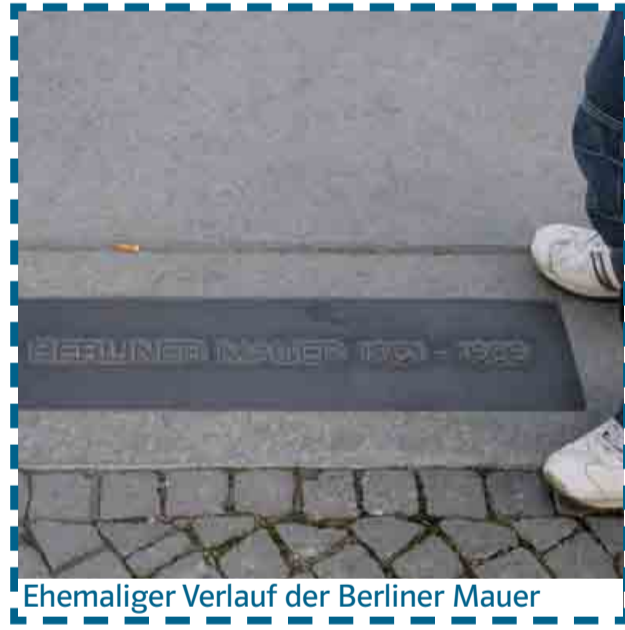
Ehemaliger Verlauf der Berliner Mauer