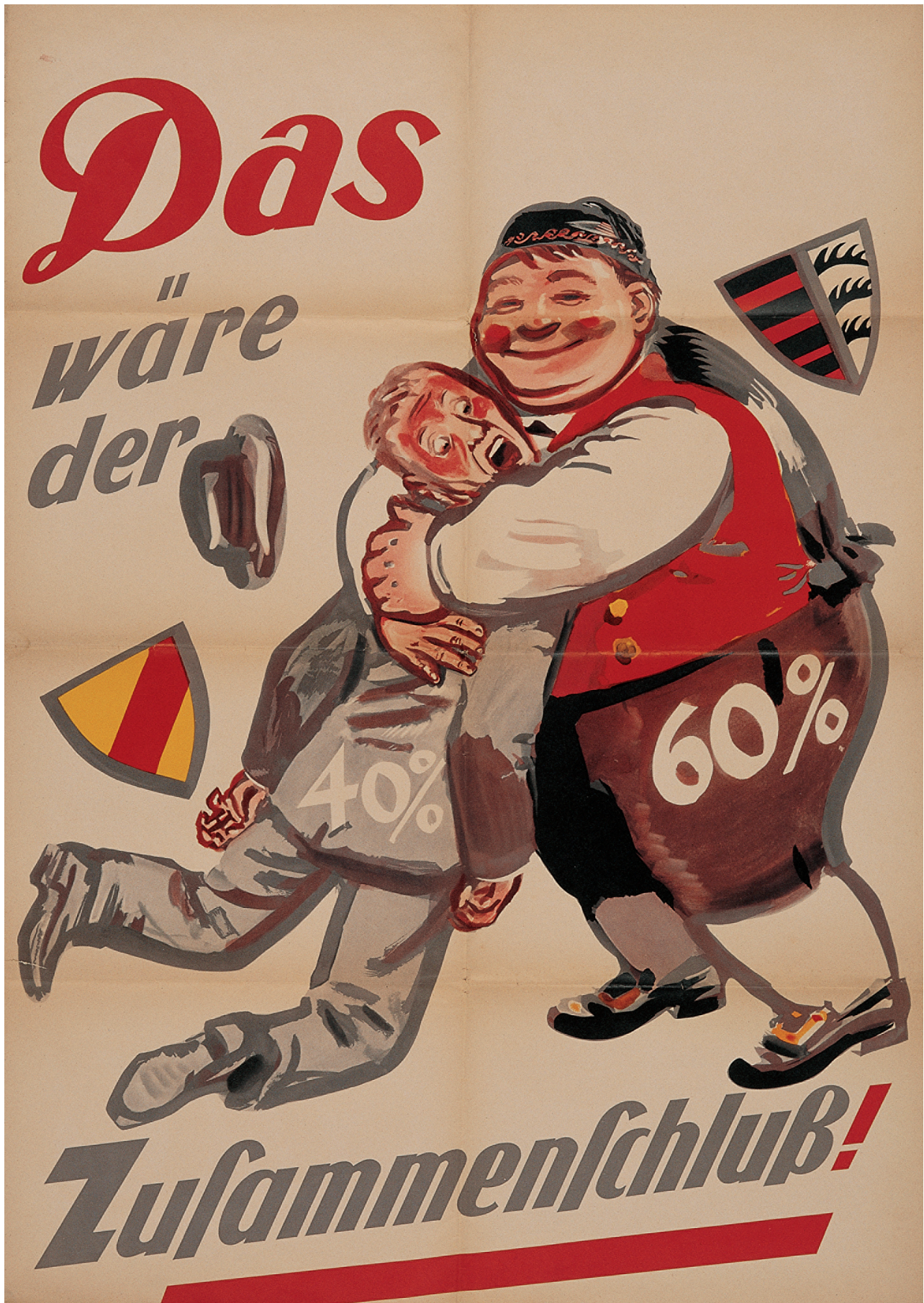
M2: Wahlplakat im Zusammenhang mit der Volksabstimmung über die Gründung des Bundeslandes Baden-Württemberg 1951