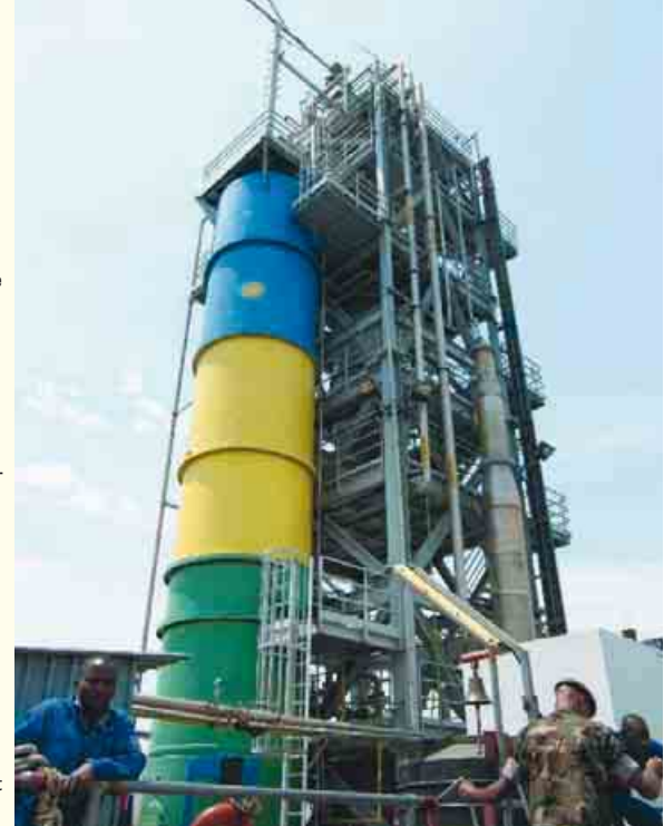
Abb. 1: Von der Krisenregion Zentralafrikas zur boomenden Nation – neue Entwicklungspole und Projekte in Ruanda (Entwurf: Michael Nieden/Volker Wilhelmi)