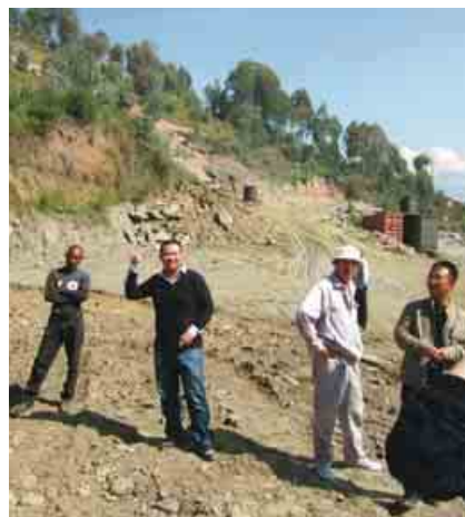
b) Straßenbau bei Kigali

Die großen Verbindungslinien Ruandas sind Straßen, bisher meist von europäischen Geberländern gebaut und instand gehalten. Nun baut China die Straßen – für viel geringere Kosten bei schlechterer Qualität und ohne große ökologische Rücksichten. Abseits der Durchgangsrouten, die eine zügige Fortbewegung gestatten, begegnen einem aber die alten unbe-