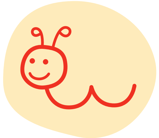
Strategiesymbol der „Leipziger Methode“