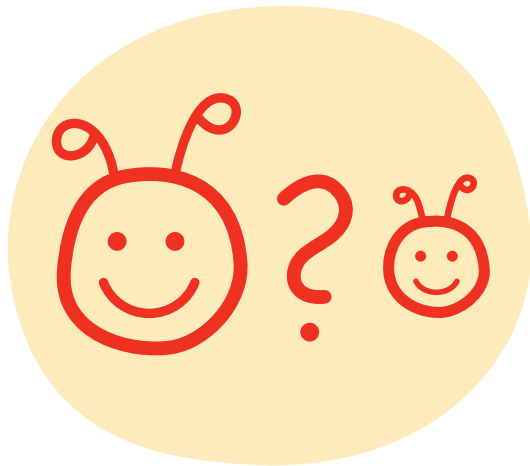
Strategiesymbol der „Leipziger Methode“