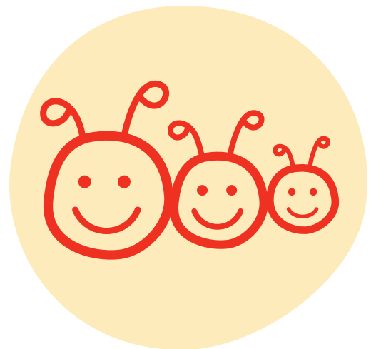
Strategiesymbol der „Leipziger Methode“