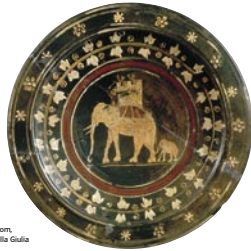
Innenseite einer griechischen Schale, 3. Jahrhundert v. Chr., Rom, Museo Nazionale di Villa Giulia

11 captivus: Gefangener 12 montanus: aus den Bergen 13 decertare: (in Zweikämpfen) auf Leben und Tod kämpfen