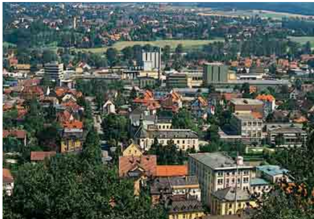
2 Klett-Archiv (Lothar Rother, Schwäbisch Gmünd), Stuttgart