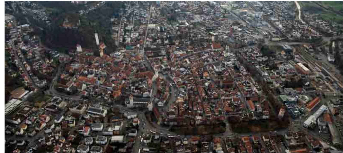
5 Schrägluftbild von Ravensburg im Jahr 2012, Blick nach Süden

Fachärzte usw.). Nach außen hin schließen sich immer jüngere Stadtteile mit unterschiedlichen Nutzungen an. Manche Stadtviertel bestehen fast ausschließlich aus Wohnhäusern, in den Industrie- und Gewerbevierteln wohnt dagegen fast niemand. Größere Freizeiteinrichtungen wie Erlebnisbäder, Fußballstadien oder Kinopaläste haben oft keinen Platz in der Innenstadt und wurden daher am Rand der Stadt gebaut.