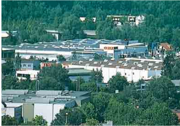
1 Klett-Archiv (Marion Rausch, Linsenhofen), Stuttgart

Du willst dich genauer mit der Viertelsbildung in deiner Stadt beschäftigen, dann bist du hier genau richtig.