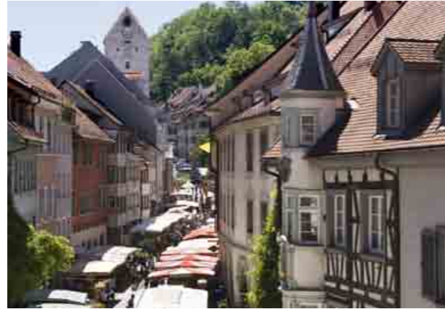
3 Stadt Ravensburg