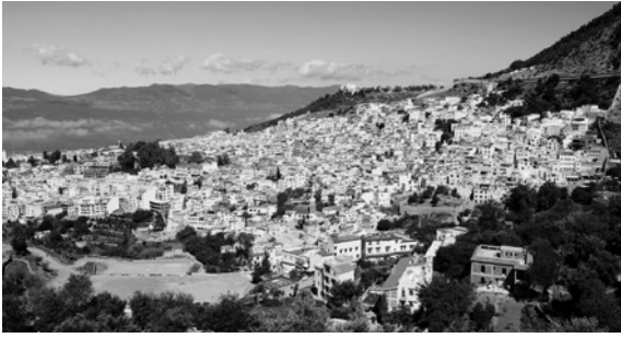
Arbeitsmaterial zu TERRA Geographie Kursstufe ISBN: 978-3-12-104133-6