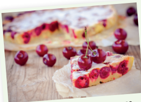
Le clafoutis, la spécialité 8 limousine