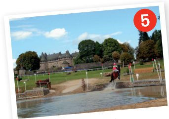
Le Haras 6 national de Pompadour