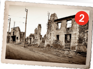
Le village 4 d'Oradour-sur-Glane