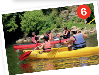
Le fleuve 7 la Dordogne