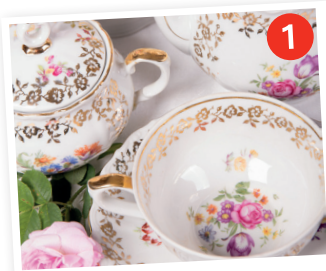
Limoges, capitale du Limousin et de la porcelaine 3

Limoges est une ville dans le Limousin, une région très intéressante au nord-ouest du Massif central. Le Limousin est aussi jumelé 1 avec la Moyenne-Franconie 2 en Allemagne.