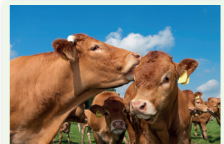
La limousine, la vache 9 du Limousin