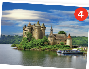
Le château 5 de Val