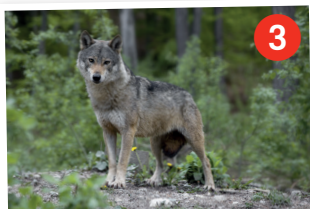
Le parc aux loups de Chabrières