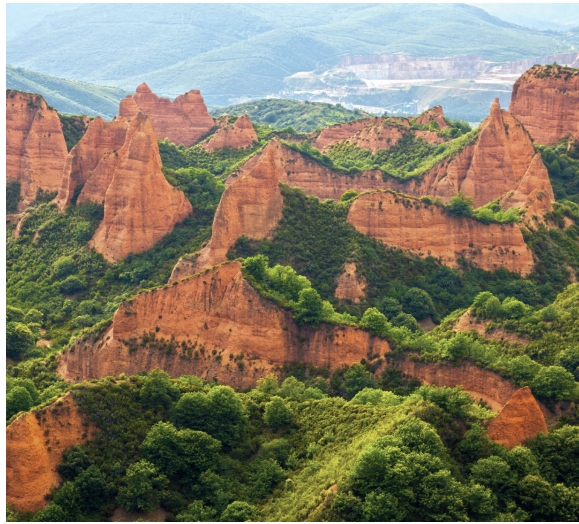
Las Médulas: minas de oro