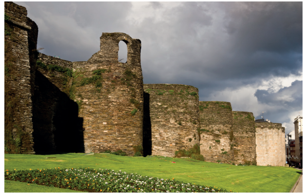
Murallas de Lugo