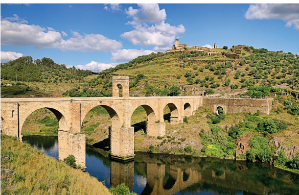
Puente de Alcántara