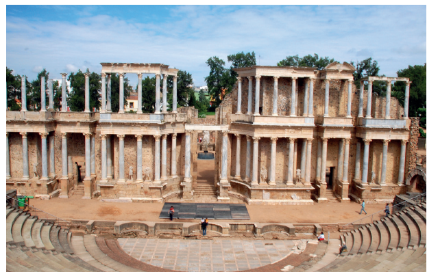
Teatro romano de Mérida