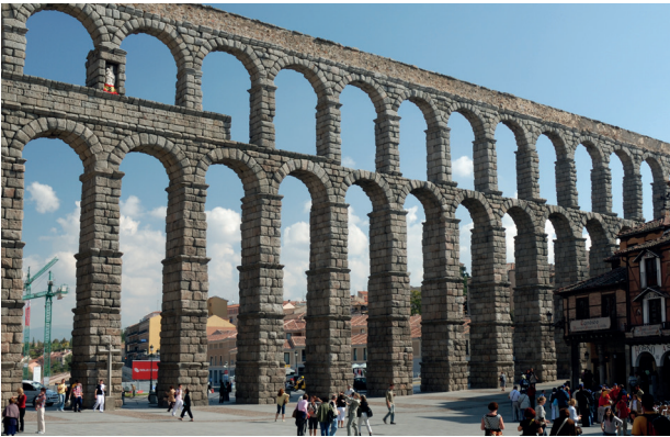
Acueducto de Segovia

Minas de oro romanas en la provincia de León. Fueron unas de las principales minas de oro del Imperio en las que trabajaban unos 20.000 hombres. Aquí se utilizó una técnica llamada ruina montium que se basa en destruir las montañas por medio de la fuerza del agua que se hacía llegar a las minas en canales. Esto ha dado origen a un paisaje muy particular.