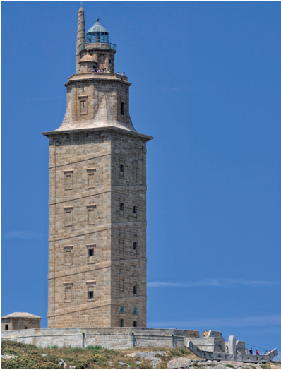
Torre de Hércules