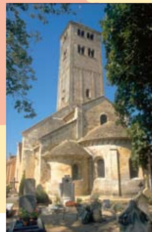
La Bourgogne et ses églises: Chapaize

1. Regardez la carte de France dans votre livre: la Bourgogne se trouve au sud de Paris. Et à l'est de ..., au nord de ..., à l'ouest de ...? Complétez dans votre cahier.