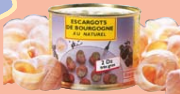
4. La Saône-et-Loire et ses escargots