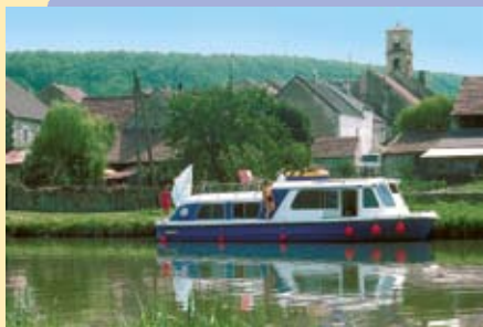
3. La Nièvre et son canal