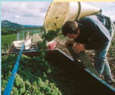
1. L'Yonne et son vin blanc