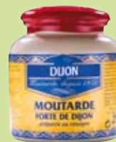
2. La Côte-d'Or son cassis et sa moutarde