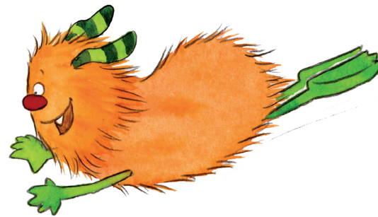
Activity Book 4, Inhaltsverzeichnis