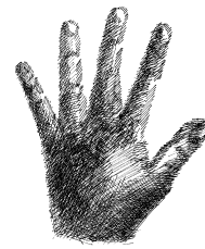
Licht und Schatten herausarbeiten