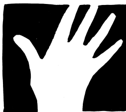
Figur und Grund definieren