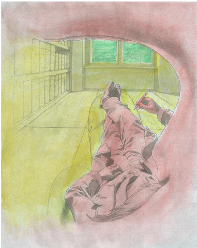
Zu didaktischen Zwecken kolorierte Grafik zu: Ernst Mach: Selbstbildnis, 1886, Zeichnung, Deutsches Museum, München