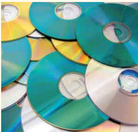
B1 Handelsübliche CDs

Das Abtasten einer CD erfolgt mittels einer Infrarot-Laserdiode (Wellenlänge 780 nm), wobei die CD von unten gelesen wird. Der Laserstrahl wird an der CD reflektiert und mit einem halbdurchlässigen Spiegel auf eine Fotodiode gebündelt (→ B2). Immer, wenn der Laser sowohl auf Pit als auch auf Land trifft, kommen zwei Teilwellen zurück, die einen geringfügig unterschiedlichen Weg zurückgelegt haben. Der Höhenunterschied zwischen Pit und Land ist dabei so gewählt, dass die Weglängendifferenz genau eine halbe Wellen-