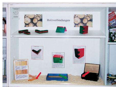
2 Schaukasten zu Holzverbindungen