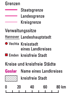
3 Landkreise und kreisfreie Städte in Niedersachsen