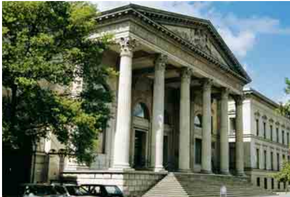
1 Leineschloss – Sitz des Landtags