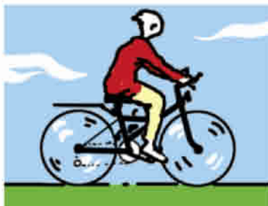
montar en bicicleta