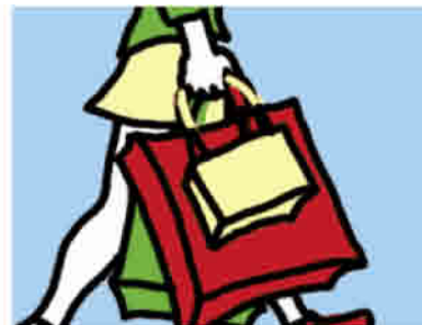
ir de compras