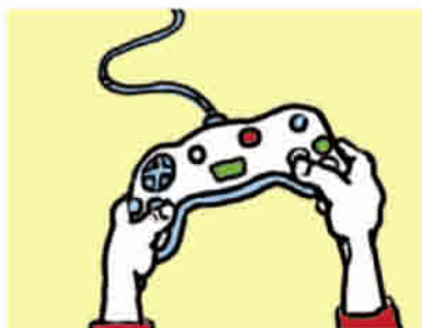
jugar con el ordenador

estudiar para un examen – hacer deporte – ir de compras – jugar al fútbol – jugar con el ordenador – montar en bicicleta – quedar con mis amigos – ver una película