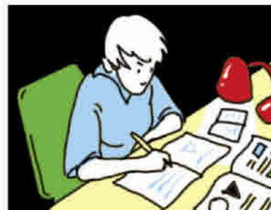
estudiar para un examen