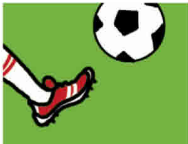
jugar al fútbol