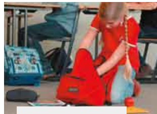
¿Qué busca la chica?