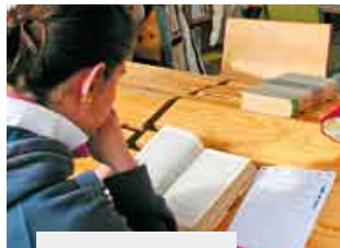
La chica estudia.