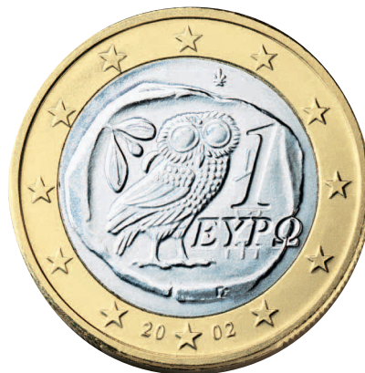
Q1 Griechische Euromünze, 2002

Hast du die Olive auf den Münzen D1 und Q1 entdeckt?