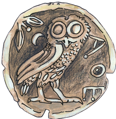
D1 Nachzeichnung der Tetradrachme (=Vierdrachmenstück) aus Athen