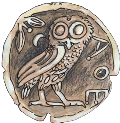
D1 Nachzeichnung der Tetradrachme (=Vierdrachmenstück) aus Athen