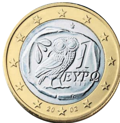
Q1 Griechische Euromünze, 2002

Hast du die Olive auf den Münzen D1 und Q1 entdeckt?