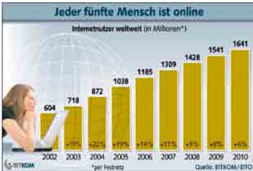
BITKOM - Bundesverband Informationswirtschaft, Telekommunikation und neue Medien e.V.

In Sachbüchern, in der Zeitung oder im Internet findest du häufig Diagramme. Sie stellen Sachverhalte und Zusammenhänge in Zahlen grafisch dar.