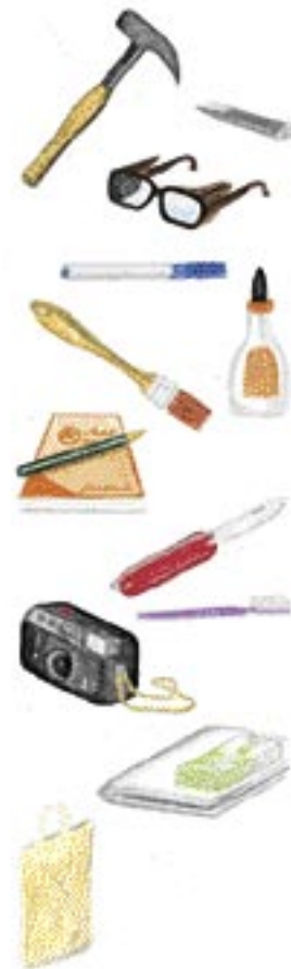
5 Hilfsmittel zum Anlegen einer Sammlung