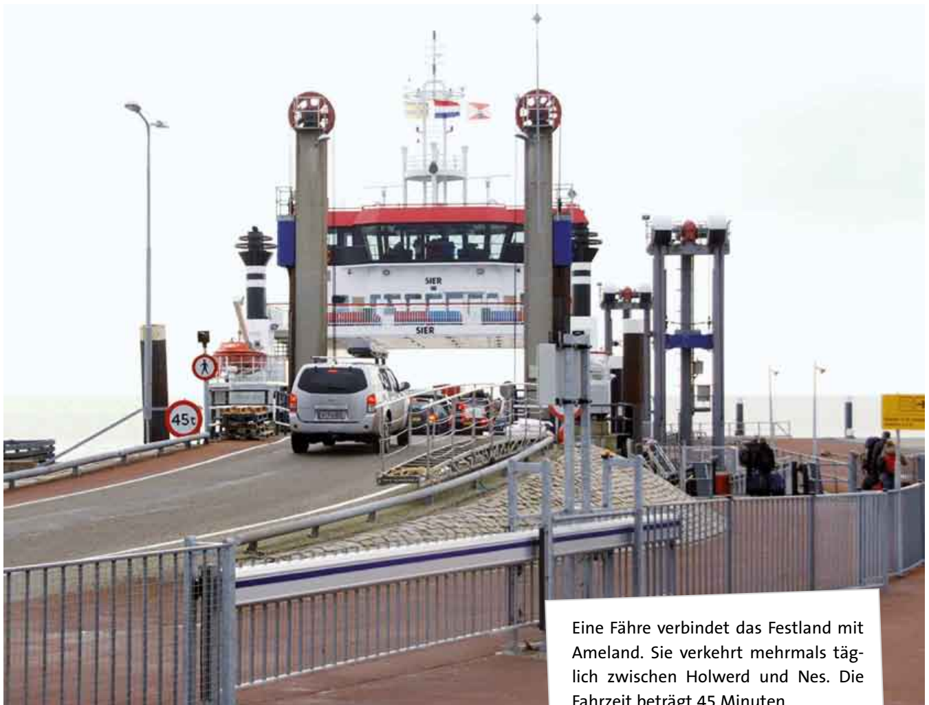
Eine Fähre verbindet das Festland mit Ameland. Sie verkehrt mehrmals täglich zwischen Holwerd und Nes. Die Fahrzeit beträgt 45 Minuten.