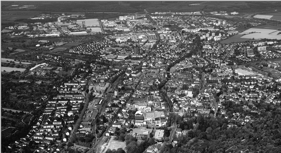
Ettlingen bei Karlsruhe 2007

6 Werte das Luftbild aus, indem du städtebauliche Merkmale den Epochen in der Tabelle zuordnest. ( _ / 6 P.)