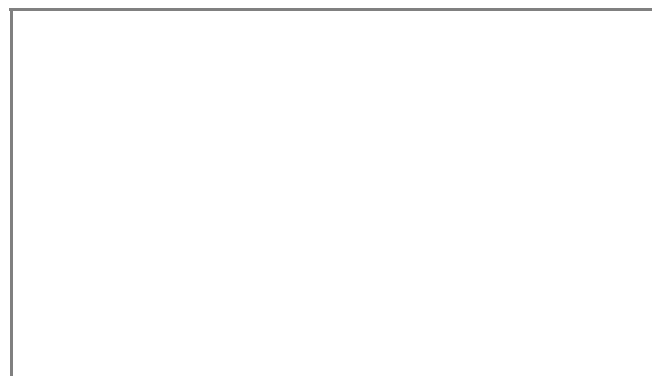
Schambach, Schönau vor dem Walde

Tipps zur selbstständigen Erweiterung auf den Folgeseiten: Zeichnungen, Fotos oder aus Prospekten entnommene Materialien zur topografischen Einordnung, evtl. Ausschnitte aus touristischem Werbematerial