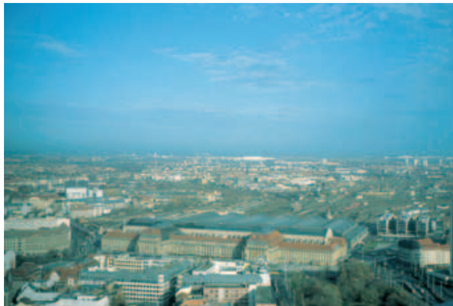
2 Schrägluftbild Leipzig (2003)