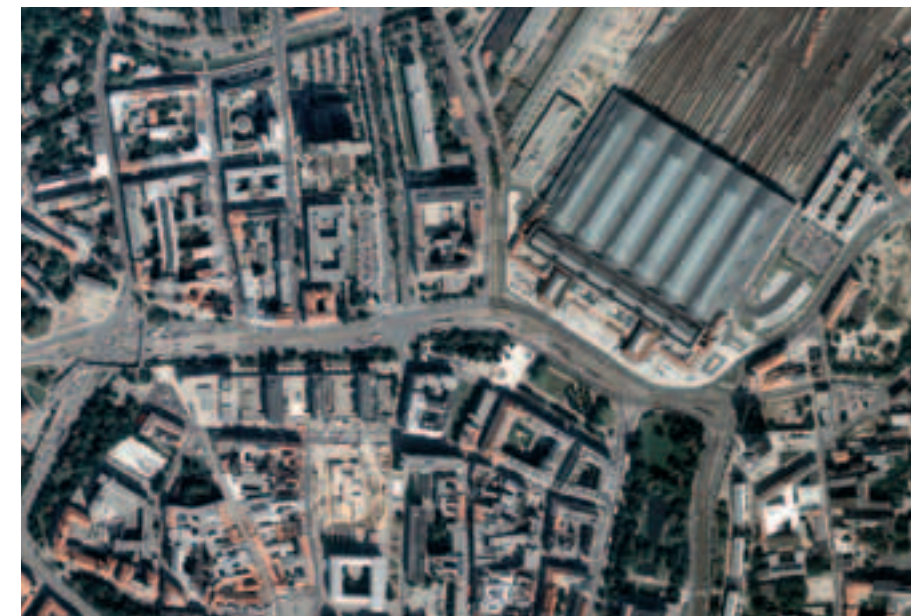
3 Senkrechtluftbild Leipzig 1:10 000 (2000)