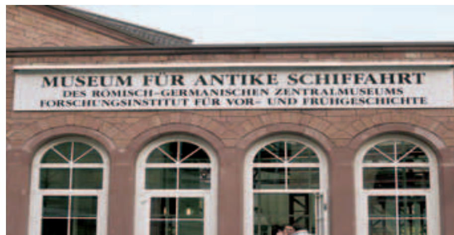
1 Das Ausflugsziel

Klasse 6b, Hauptschule Höhr-Grenzhausen: In vier Wochen geht der Klassenausflug los – nach Mainz ins neue Museum für antike Schifffahrt. Jetzt muss geplant werden!