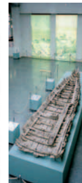
4 Im Museum