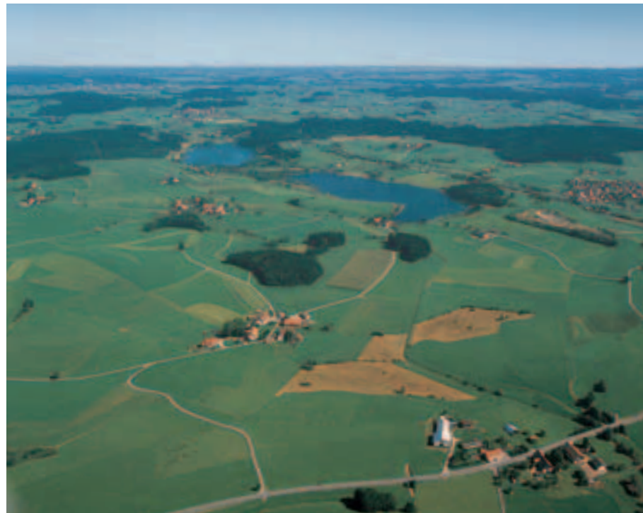
1 Allgäu bei Wangen