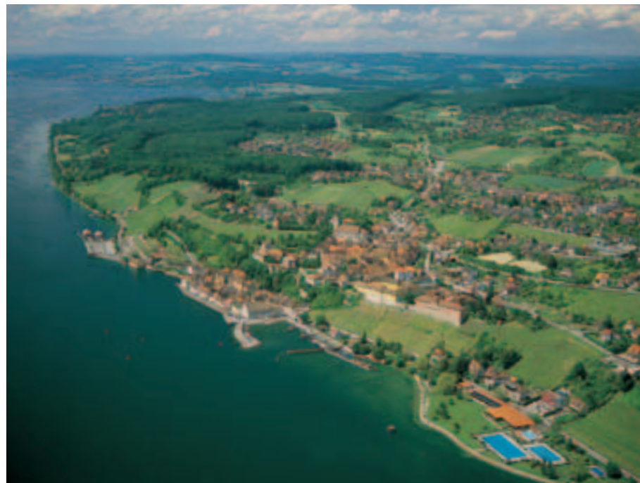
2 Meersburg am Bodensee