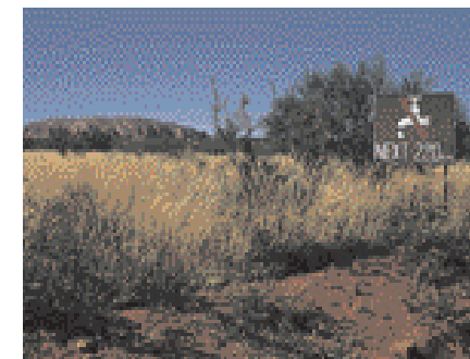
7 Nahe Ayers Rock