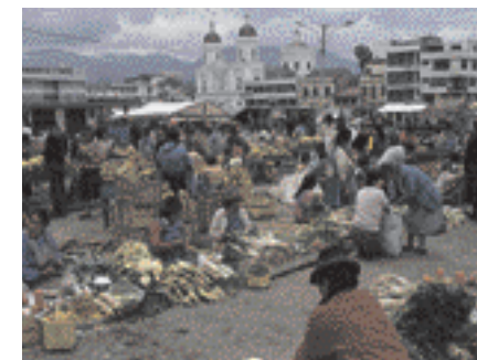
6 Bei Quito