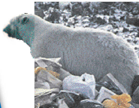
1 Eisbär auf einem Müllplatz in Churchill

Christianskoog 22/23 DE1 Christmasinsel 92/93 C5 Chromtau 85/87 E4 Chubut 118 B4 Churchill, Stadt in Kanada 106/107 J4 Churchill, Fluss zur Hudson Bay 106/107 M4 Cienfuegos 108/109 E4 Cima dell' Argentera 60/61 I3 Cincinnati 108/109 E3