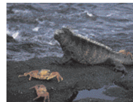
8 Meerechsen auf den Galapagosinseln