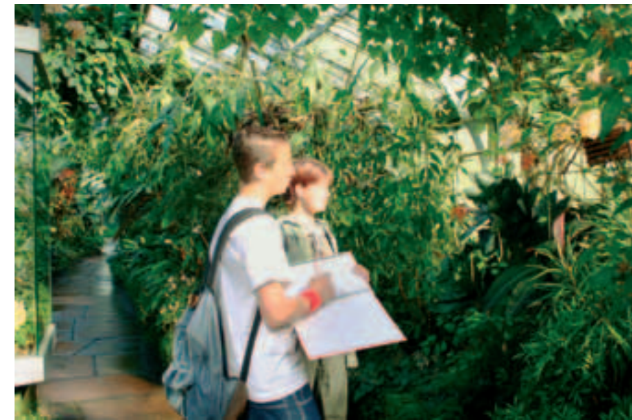
2 Schüler erkunden in der Wilhelma in Stuttgart

Stellt die Erkundungsergebnisse zusammen. Holt euch weitere Informationen ein, z. B. im Internet, in Lexika oder Fachliteratur. Gestaltet eine Präsentation, z. B. in Form einer Ausstellung.