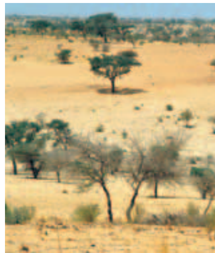
1 Savanne während der Trockenzeit