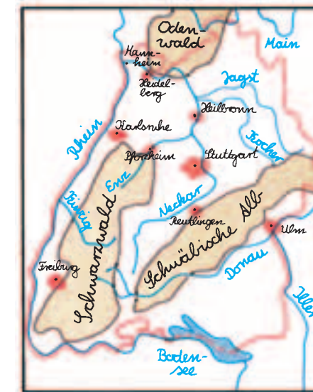
3 Städte, Grenzen und Namen

3. Schritt: Wähle für die Gebirge einen braunen Farbstift. Damit umfährst du zum Beispiel den Schwarzwald entlang der Farbfläche oder Signatur für Mittelgebirge und malst diese Fläche braun an.