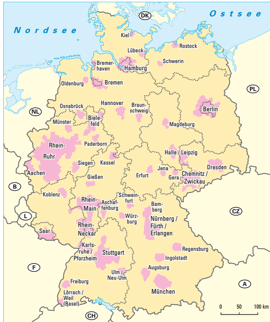
1 Verdichtungsräume in Deutschland