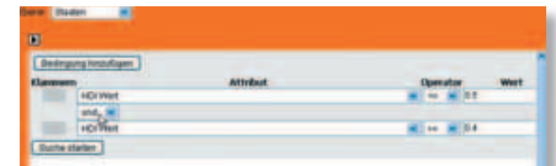
5 Abfragemanager mit Abfrage zu den Staaten mit vergleichbarem HDI wie Angola

Zum Vergleich Angolas mit Staaten gleichen Entwicklungsstandes wie Angola kann z.B. dessen HDI-Wert (2003: 0.445) herangezogen werden. Zur Suchabfrage bieten sich als selbst definierte Schwellenwerte dabei die HDI-Werte 0.400 und 0.500 an. Zu beachten ist, dass die Dezimalzahlen mit einem Punkt statt Komma eingegeben werden. Die zu wählende Relation ist „ und “ (Abbildung 5). Auch hier erscheint nach „Suche starten“ die exportierfähige Trefferliste (Abbildung 6). Mit einem entsprechenden Klick können die gefundenen Länder in der Karte dargestellt werden.