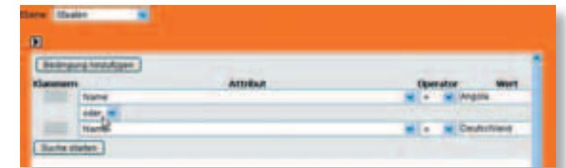
3 Abfragemanager mit Abfrage zu den Basisdaten für Angola und Deutschland