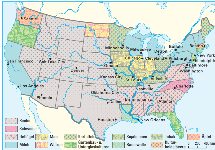
1 Nutzung mit den höchsten Erlösen in der US-Landwirtschaft nach Bundesstaaten

Jede Karte stellt für einen Raum ein bestimmtes Thema dar. Manche Karten enthalten nur Informationen zu einem Thema, z. B. der Bodenfruchtbarkeit, andere dagegen stellen mehrere statistische Inhalte oder auch Entwicklungen dar. Solche Karten lesen und erklären zu können, gehört zu den wichtigsten Aufgaben im Geographieunterricht.