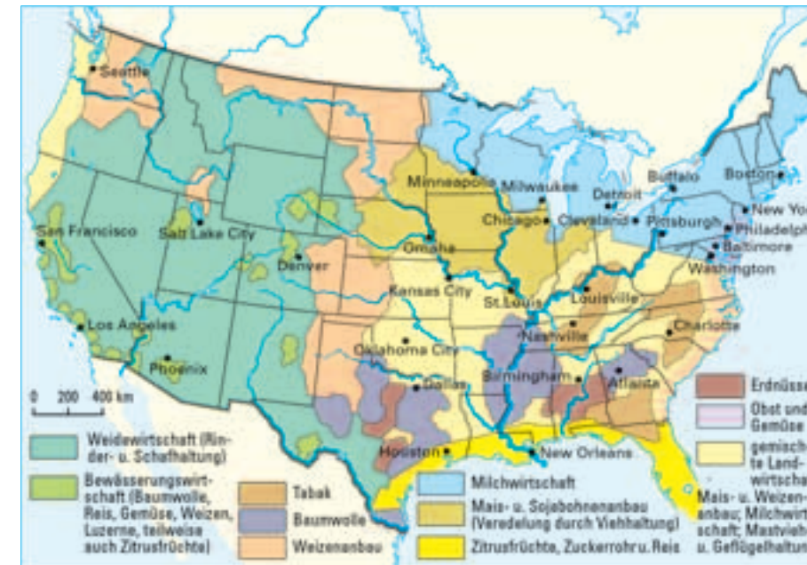
4 Landwirtschaftliche Nutzung in den USA