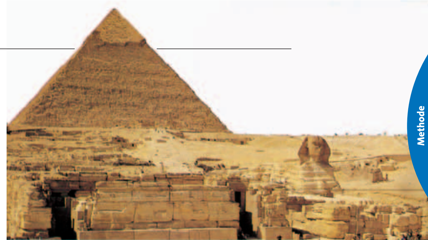
1 Pyramide bei Gise, nahe Kairo

Ein Referat ist ein mündlicher Vortrag zu einem vorgegebenen Thema. Eine gründliche Vorbereitung ist für das Gelingen mindestens ebenso wichtig wie eine anschauliche Präsentation. Beachte bei allem die fünf „W’s“ für ein gutes Referat!