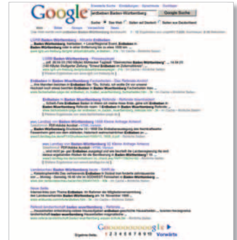
2 Seite von der Suchmaschine Google (12. Mai 2003)