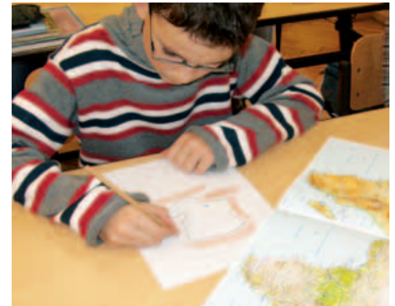
2 Eine Kartenskizze entsteht