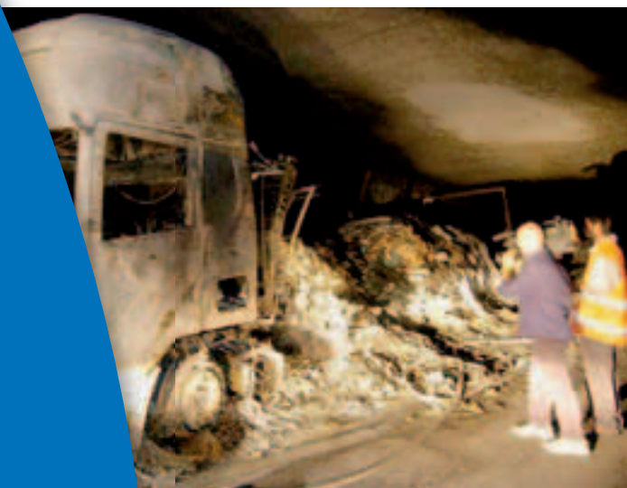
1 Der Brand im Frejus-Tunnel