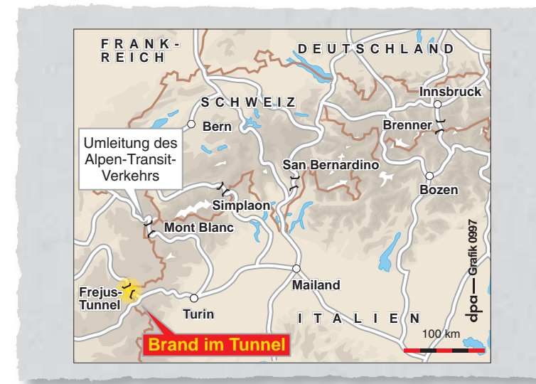
4 Karte von der Unglücksregion in der Tageszeitung