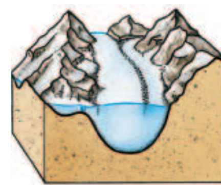
4 eiszeitlicher Gletscher

Skizziere dünn mit einem Bleistift die Vorderansicht des Blockbildes. Wenn du mit deiner Skizze zufrieden bist, zeichne die Umrisse kräftiger nach und zeichne den Fluss und die wirkenden Kräfte ein.