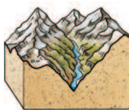
2 voreiszeitliches Kerbtal (V-Tal)