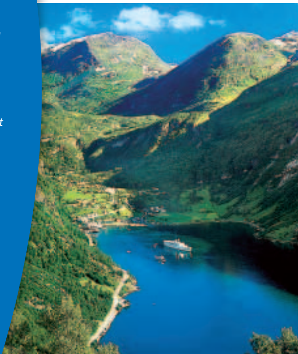
1 Geirangerfjord in Norwegen

Die Landschaften der Erde sind in vielen Millionen von Jahren entstanden und werden auch heute noch ständig verändert. Diese Vorgänge kannst du dir in einfachen Skizzen sehr gut verdeutlichen.