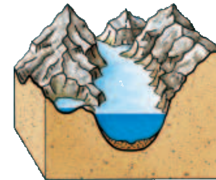
6 heutiger Fjord mit einem Trogtal (U-Tal)

In der nächsten Skizze solltest du von der Mitte ausgehen. Dort, wo der Fluss war, füllte sich das Tal mit Gletschereis. Es formte die Wände und die Talsohle. Zeichne die Wände weiter auseinander und die Talsohle etwas tiefer. Zeichne das Gletschereis und die wirkenden Kräfte ein.